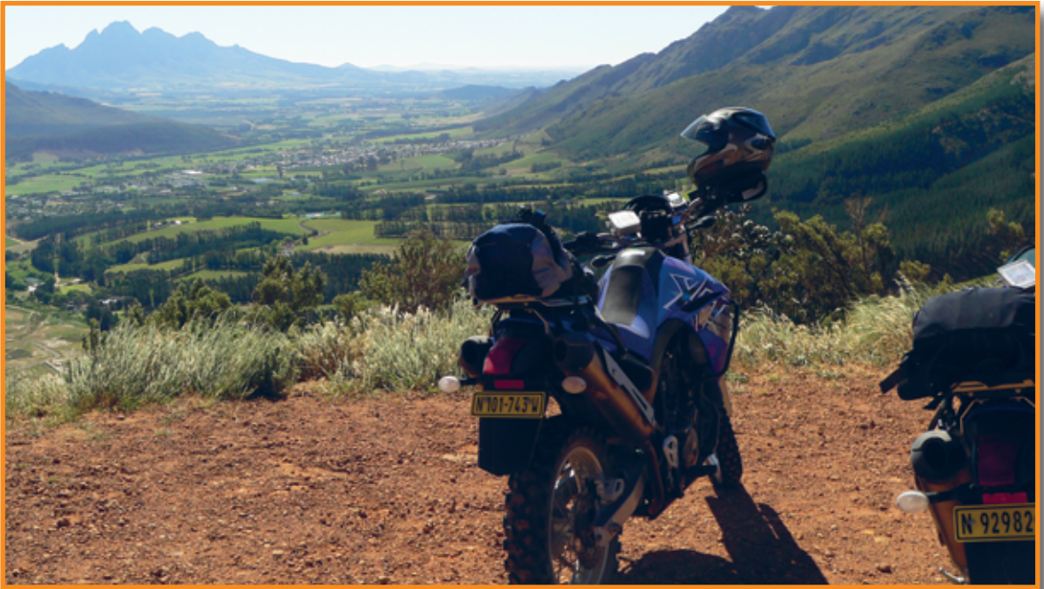
Ausblick vom Franschoek Pass!