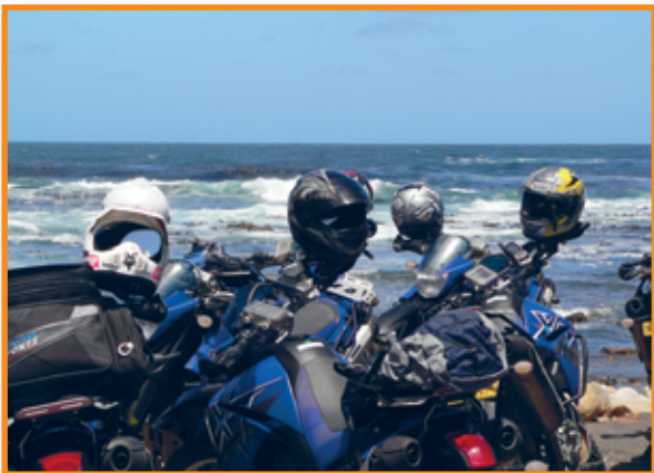
Pause am Kap der guten Hoffnung!

Wege, mit Treppen und Wasserdurchfahrten nach einem ziemlich steilen Anstieg ein kurzes Stück über die Höhe und dann in gleicher Manier wieder nach unten. 30 km die es in sich hatten und es hat einen riesigen Spaß gemacht. Nach weiteren 80 km folgte eine gnadenlose 35 km lange Sandstrecke. Für mich eine Erfahrung mehr – losfahren Gas geben ( aber richtig ) hinstellen und ab geht die Post. Ein super Tag. Und es folgten noch mehr dieser Art. Von da an war jeder Tag nur noch Genuss. Die Unterkünfte ließen keine Wünsche offen und nach 350-460 km täglicher Endurostrecke wartete garantiert eine schöne Unterkunft auf uns. Am Tag konnte man sich auf das Motorradfahren und die