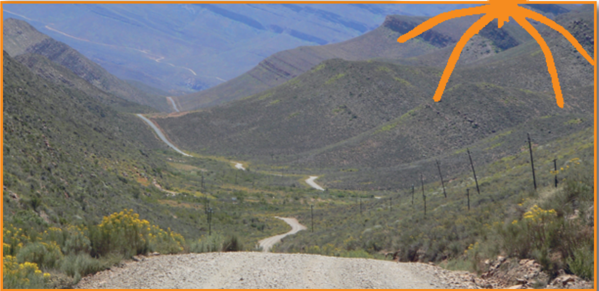
Was für eine Bergstrecke!

freundlicher Zustimmung einen Stempel. Dann wars geschafft – der Zettel musste draussen einem Beamten abgegeben werden und raus aufs Moped und ab dafür. Kurz nach der Grenze lag die Lodge – kleine Chalets für zwei Personen direkt am Oranje River. Man liegt auf dem Bett und genießt die Aussicht über den Fluss und die im Hintergrund liegenden Berge. Am nächsten Tag gings entlang des Oranje Rivers wieder zur Küste nach Lüderitz und hier gabs es dann auch Kultur. Eine Besichtigung der verlassenen Diamantenstadt Kolmannskoop. Es wurde immer wärmer und die Strecke entlang des Namib Naukluft Parks bei über 40 Grad und tiefem groben Schotter war doch eine „heiße“ Strecke. Hier war ich dann doch dankbar den Camelbag mit genügend Wasser auf dem Rücken zu haben. Für diese Strecke wurden wir mehr als belohnt, als wir zur Lodge „Desert Homestead“ kamen. Eine Oase mitten im Nichts.