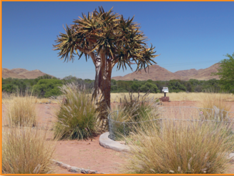
Einer von vielen Köcherbäumen!